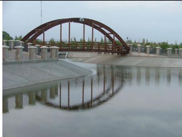
Parque del Andarax